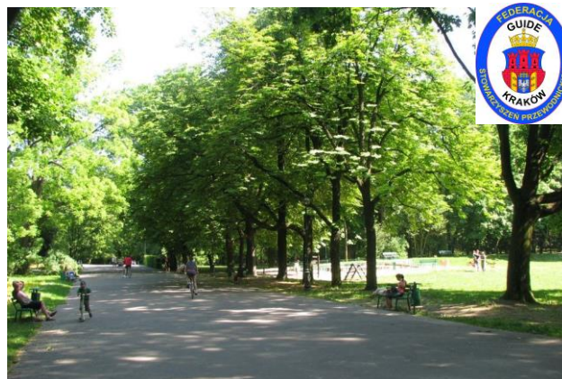
Le parc Wojciech Bednarski