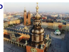
Cracovie - Plaza del Mercado