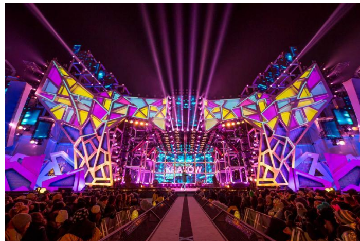
Powitanie Nowego Roku w Krakowie

Program: koncerty i zabawy taneczne na placach Krakowa