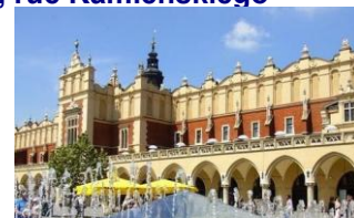
Cracovie - Plaza del Mercado

Accès à Internet gratuit aux hôtels et au pensionnat.